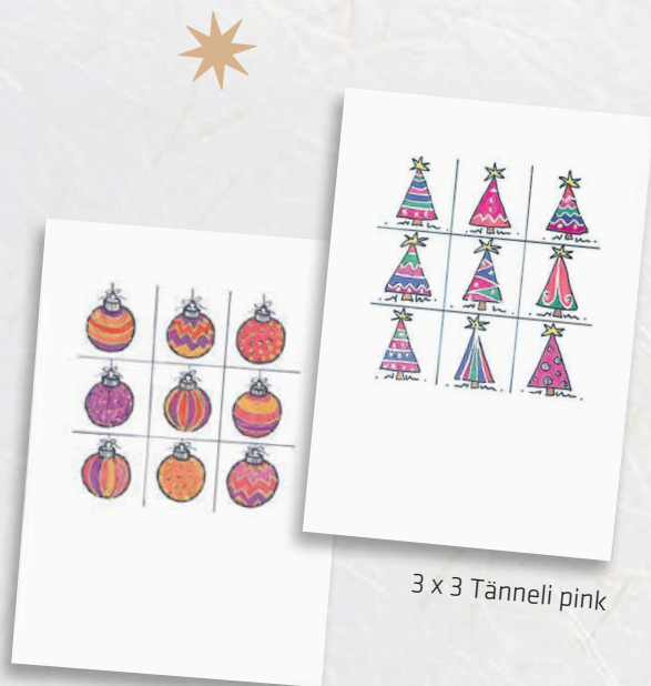
3x3 Weihnachtskugeln rot

Karten und Geschenke von Wisli sind etwas ganz Besonderes. Mit grosser Sorgfalt und Liebe zum Detail von Hand gefertigt, sind sie ein perfekter Festtagsgruss. Die Karten sind mit Silber und Glimmer verfeinert – jedes Exemplar ist ein Unikat. Alle Karten werden mit Einlageblatt und einem Couvert geliefert.